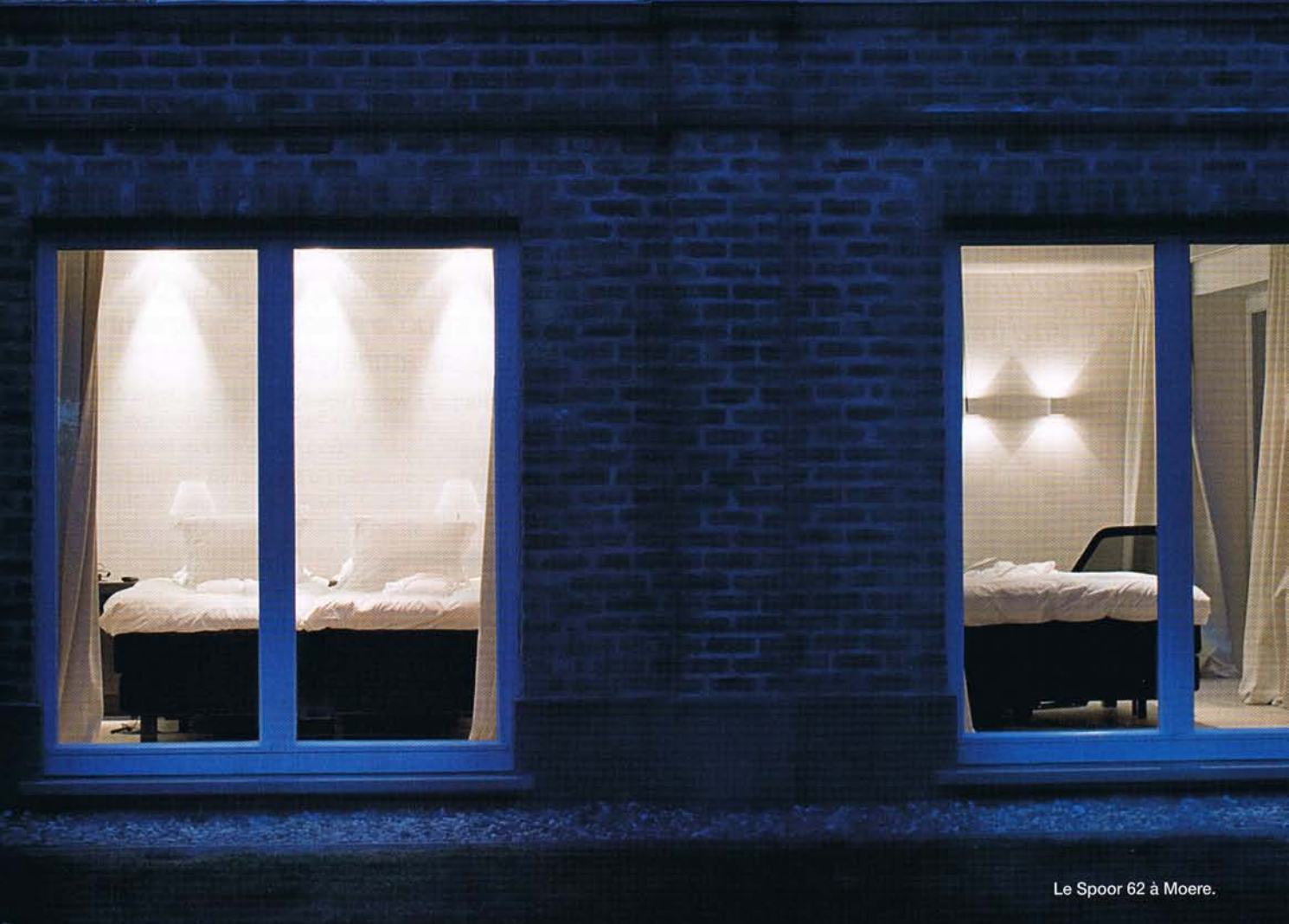
Le Spoor 62 à Moere.